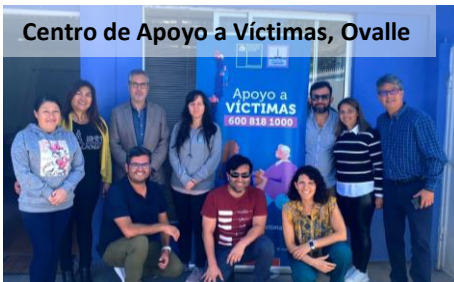
Centro de Apoyo a Víctimas, Ovalle