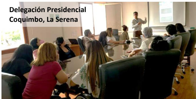
Delegación Presidencial Coquimbo, La Serena