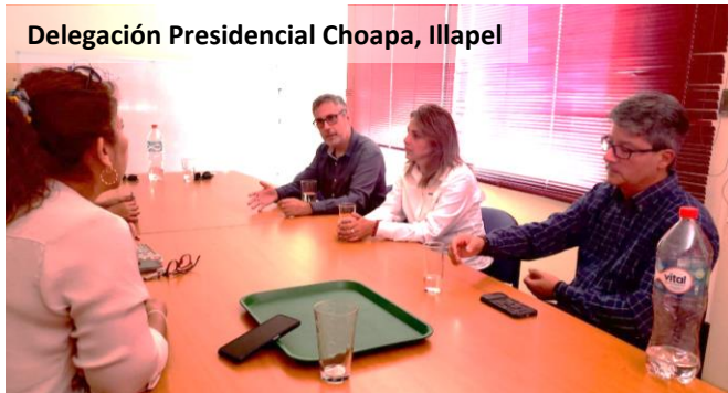
Delegación Presidencial Choapa, Illapel