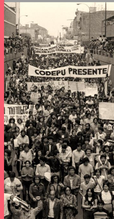
La Imagen abajo corresponde al funeral de André Jarlán, 5 de septiembre de 1984. Sería una de las mayores concentraciones en contra de la dictadura. Ambas constituyeron la precuela del término de la dictadura