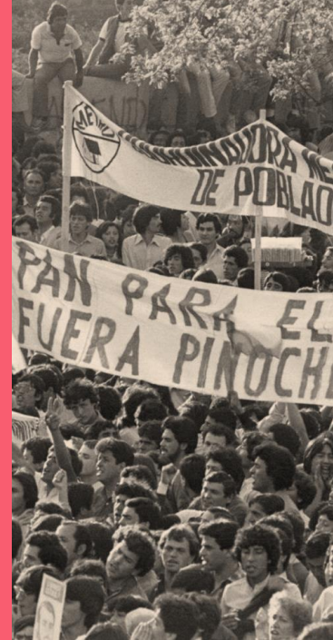
La imagen arriba es mayo de 1983 y corresponde a las protestas bajo el liderazgo inicial de la Confederación de Trabajadores del Cobre y, posteriormente, de la Alianza Democrática y el Movimiento Democrático Popular (MDP), entre otros.