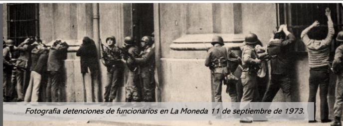
Fotografía detenciones de funcionarios en La Moneda 11 de septiembre de 1973.